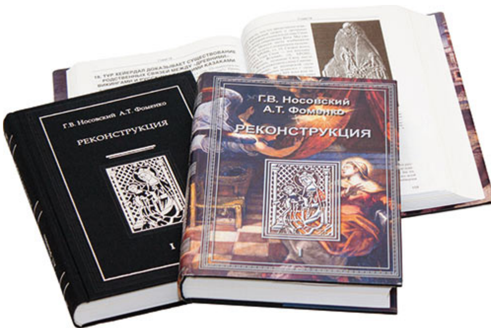
Рис. 6. Переплет книги и ее футляр