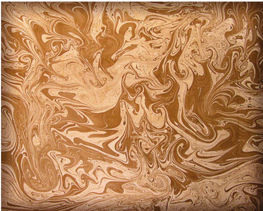
Рис. 7. Форзац в стиле акватипии (мраморная бумага)

Форзацы могут быть одноцветными и цветными, а также беспредметными или тематическими (рис. 7 и 8).