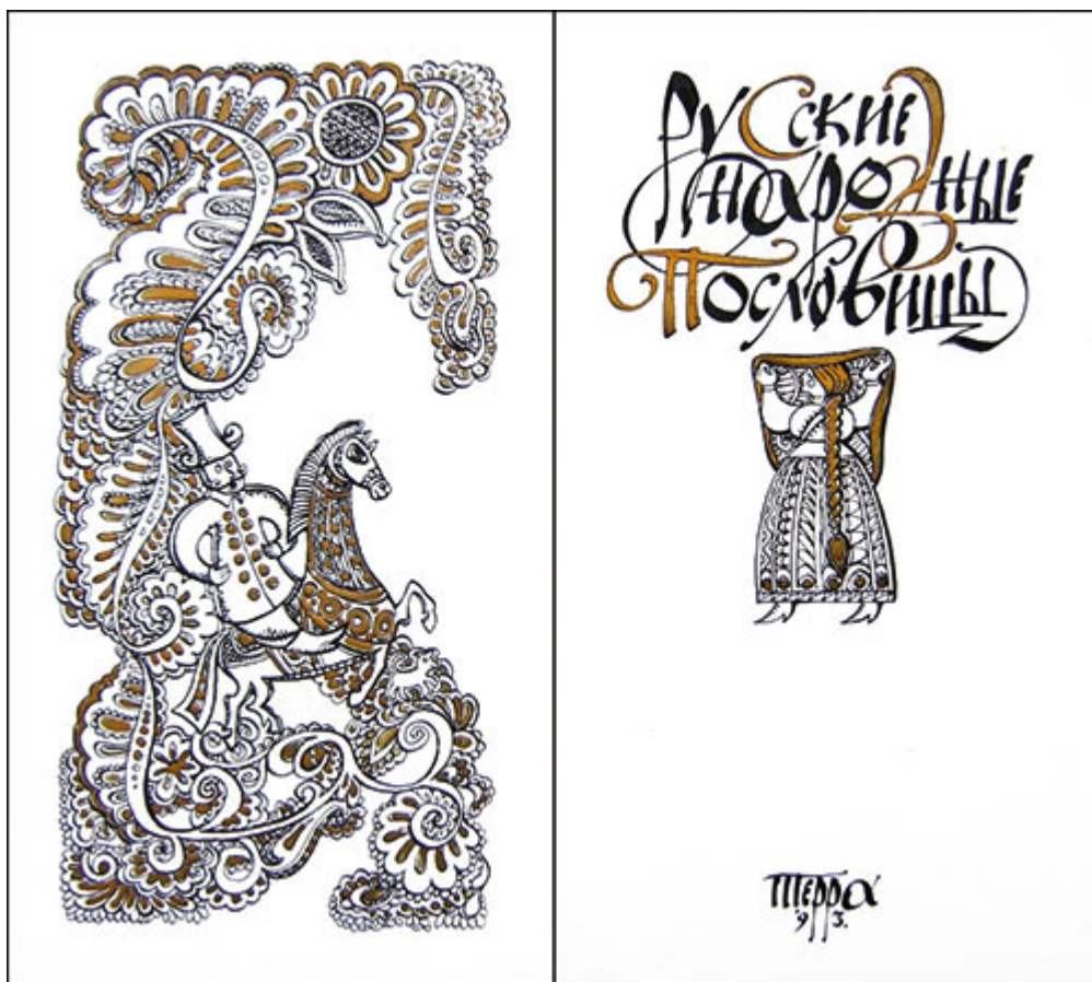
Рис. 9. Двойной титул. Автор: Булат Гильванов

Двойной титульный лист занимает четыре страницы (два листа с оборотом) — рис. 9. Выходные сведения попрежнему занимают одну страницу, на других страницах можно просторно и красиво расположить остальную информацию. В двойном титульном листе выделяют отдельные страницы в зависимости от информации, которая на них вынесена.